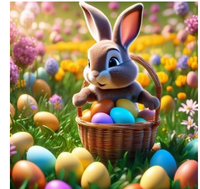
KI generiert

Eine schöne Osterzeit und tolle Ferien wünscht