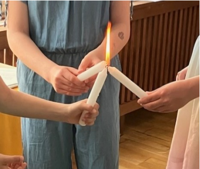
Kindergottesdienst in F'felde

Auch in diesem Jahr feiern wir eine Woche nach Pfingsten das Fest der Heiligsten Dreifaltigkeit. So mancher Theologe hat versucht, eine schlüssige Erklärung für dieses Gedankenkonstrukt zu finden, andererseits wird aber auch immer wieder betont, dass die Dreifaltigkeit nicht zu erklären ist. Dabei ist sie doch quasi die Basis unseres Glaubens. Überlegen Sie mal, wie oft Sie das Kreuzzeichen machen und dabei wenigstens in Gedanken von Vater, Sohn und heiligem Geist sprechen.