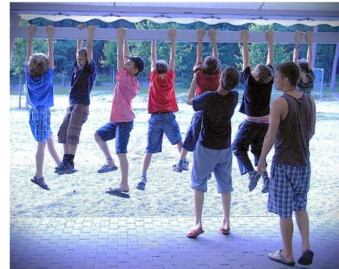
„Einfach mal abhängen ...“ Sommerfahrt 2009 / Foto: privat